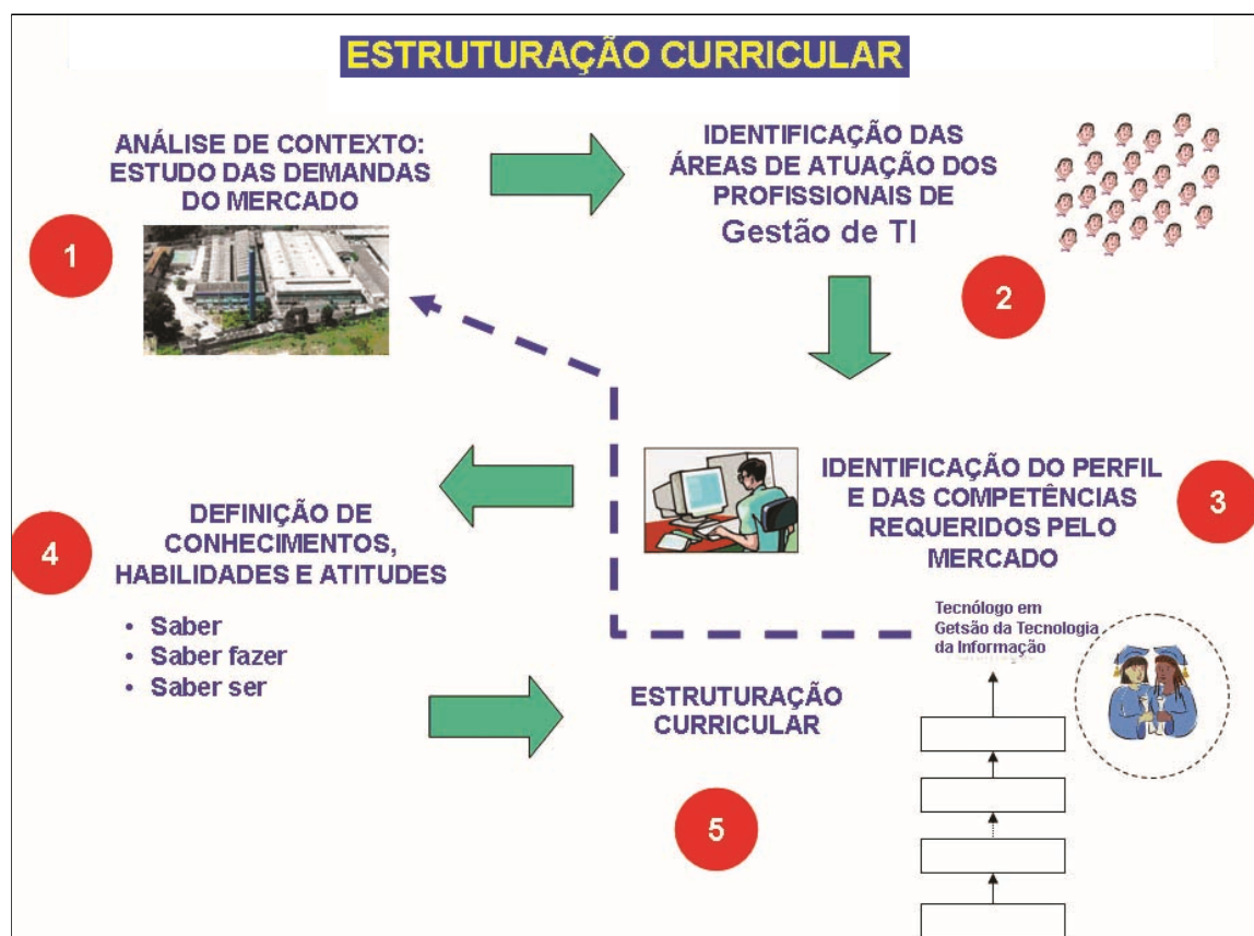
Figura 1 - Esquema de Estruturação do CST GTI

A figura 1 apresenta o esquema da sequência de atividades de estruturação do Curso Superior de Tecnologia em Gestão da Tecnologia da Informação.