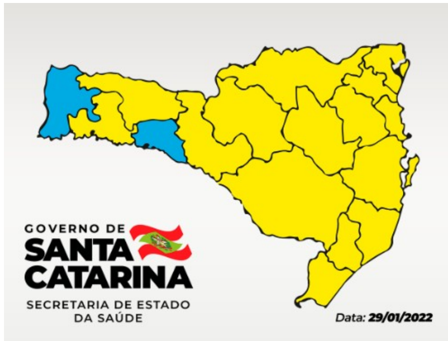
Situação do estado de SC - Fase 4