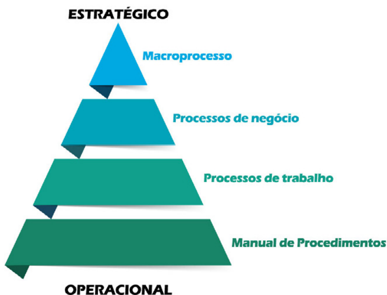
Figura 1.3. Relação entre os níveis de detalhamento do mapeamento.

A linguagem de mapeamento padrão do IFSC possui quatro níveis de detalhamento. Cada nível possui seu conjunto específico de dimensões mapeadas, um público-alvo e um propósito. Os níveis estão ligados entre si por uma relação de desdobramento, ou seja, níveis mais detalhados são oriundos de níveis menos detalhados e níveis menos detalhados são agregações de níveis mais detalhados. Os níveis são os que seguem, conforme Figura 1.3, do mais agregado para o mais detalhado.