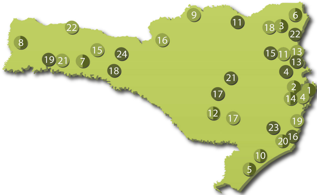
Figura 4.3 - Núcleos de Educação a Distância (NEADs) e Polos UAB.

Através da articulação entre seus diversos câmpus, o IFSC ofertará mais de 3.000 novas vagas, com recursos da CAPES/UAB, em 16 cursos superiores de tecnologia, licenciaturas e especializações, com foco na formação de professores e agentes públicos, na vigência do PDI 2025-2029 (Figura 4.4.)